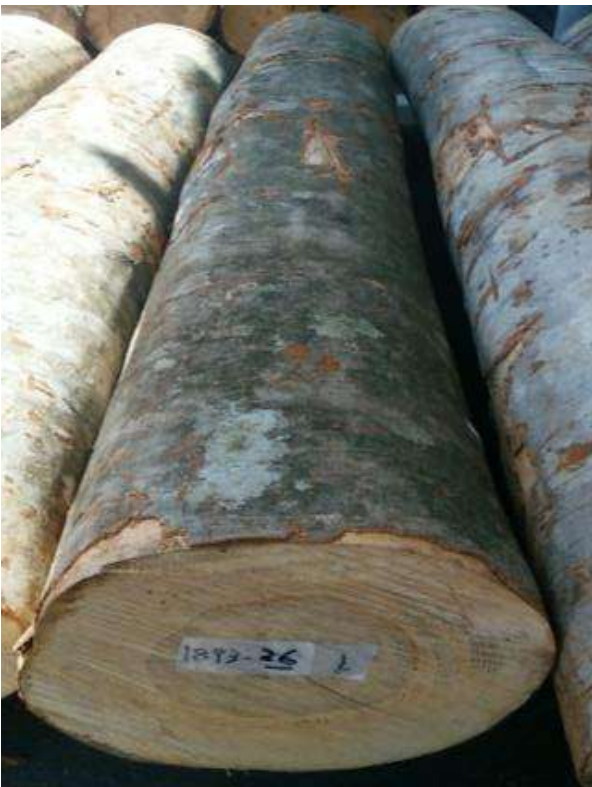
樹種: ブナ 材長: 2.2 m 管理No. 26 径級: 30 cm 本数: 1 材積: 0.198 m 3