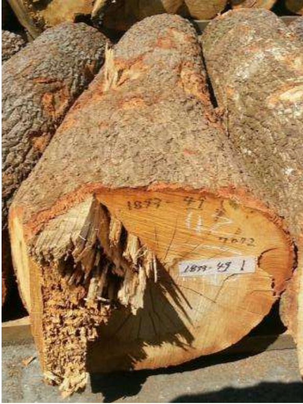
樹種: クヌギ 材長: 2.0 m 管理No. 49 径級: 42 cm 本数: 1 材積: 0.353 m 3