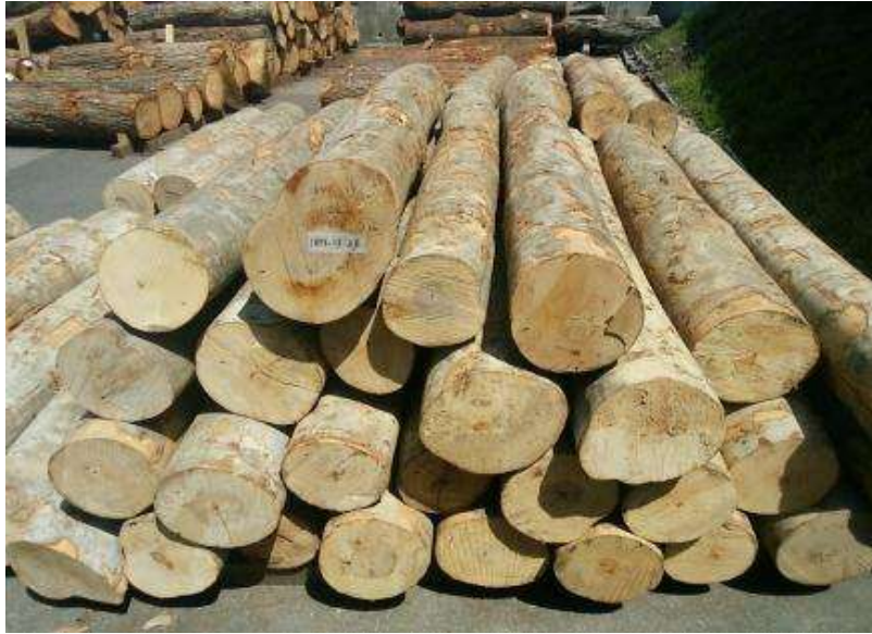
樹種: ブナ 材長: 1.8-2.2 m 管理No. 11 径級: 22-28 cm 本数: 28 材積: 3.674 m 3