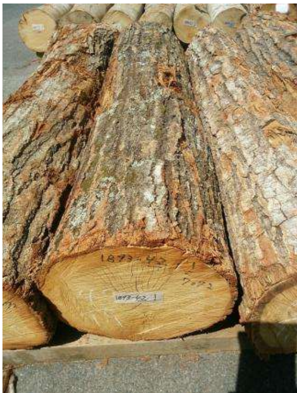
樹種: ナラ 材長: 1.9 m 管理No. 42 径級: 40 cm 本数: 1 材積: 0.304 m 3