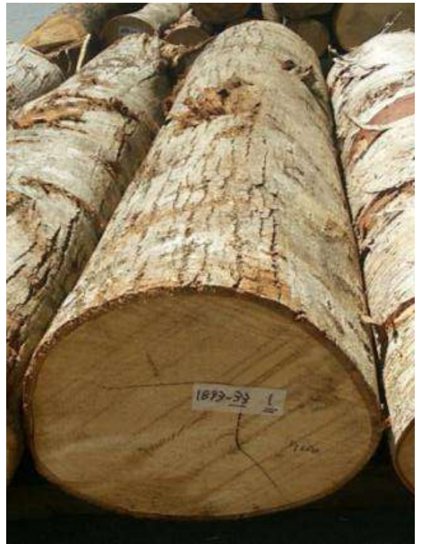
樹種: シナ 材長: 2.2 m 管理No. 33 径級: 36 cm 本数: 1 材積: 0.285 m 3