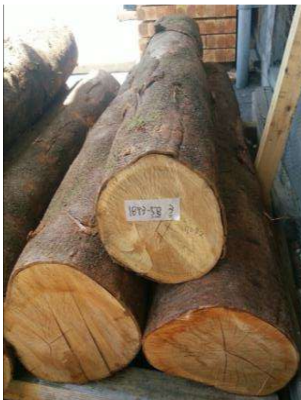
樹種: サクラ 材長: 1.9-2.2 m 管理No. 58 径級: 26-30 cm 本数: 3 材積: 0.497 m 3