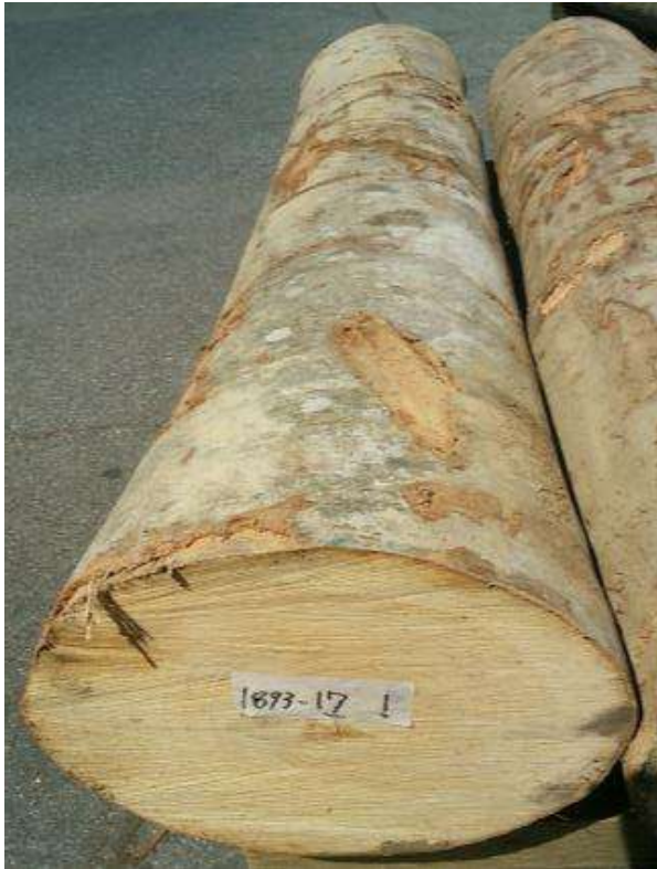
樹種: ブナ 材長: 2.2 m 管理No. 17 径級: 32 cm 本数: 1 材積: 0.225 m 3