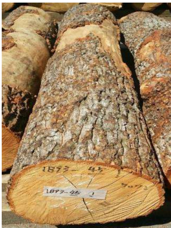
樹種: クヌギ 材長: 2.2 m 管理No. 45 径級: 32 cm 本数: 1 材積: 0.225 m 3