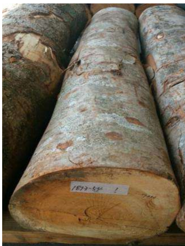
樹種: ケヤキ 材長: 2.1 m 管理No. 54 径級: 32 cm 本数: 1 材積: 0.215 m 3