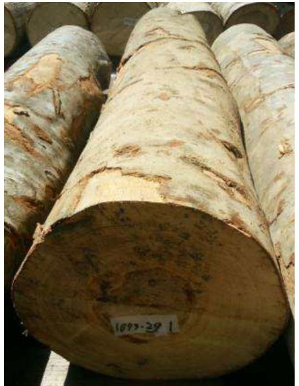
樹種: ブナ 材長: 1.8 m 管理No. 29 径級: 38 cm 本数: 1 材積: 0.260 m 3