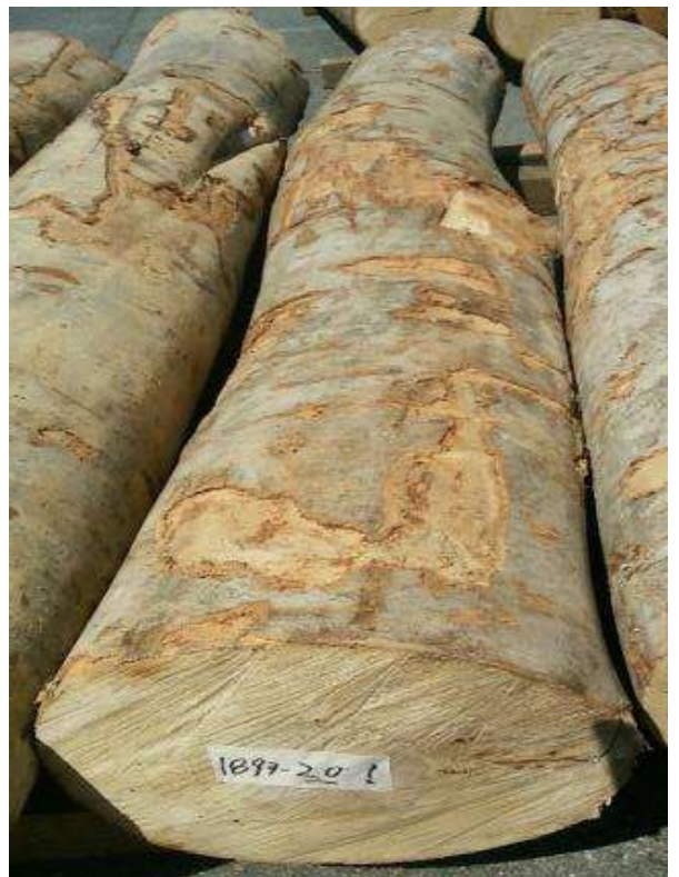
樹種: ブナ 材長: 2.2 m 管理No. 20 径級: 28 cm 本数: 1 材積: 0.172 m 3