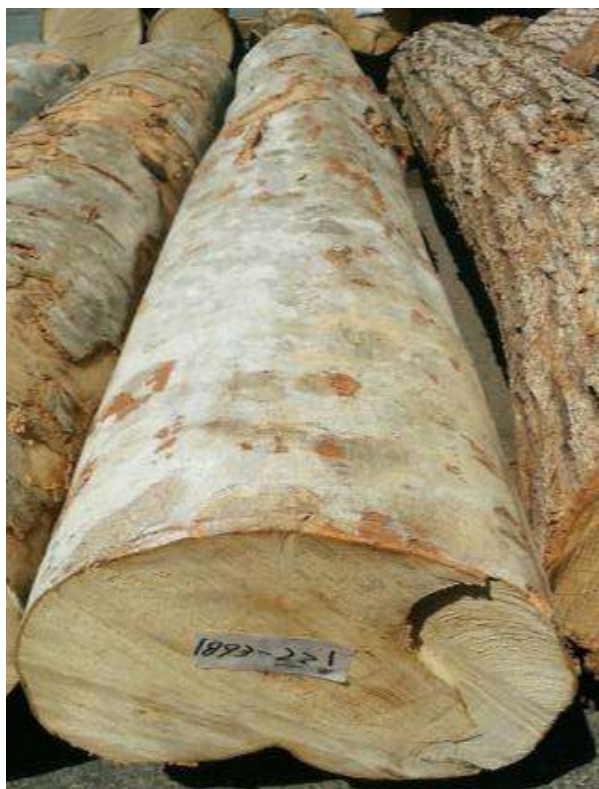
樹種: ブナ 材長: 2.2 m 管理No. 22 径級: 30 cm 本数: 1 材積: 0.198 m 3