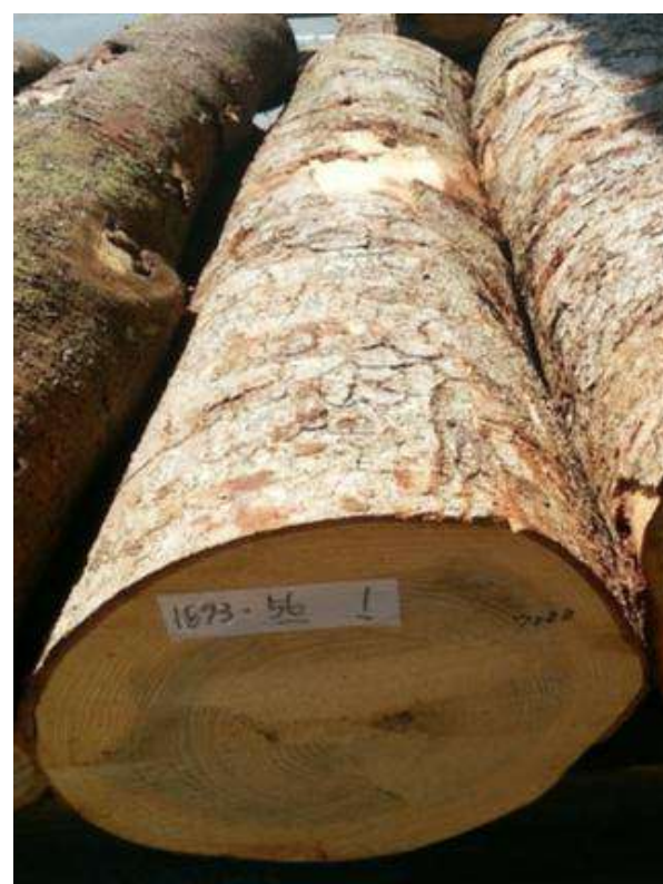
樹種: モミ 材長: 2.1 m 管理No. 56 径級: 38 cm 本数: 1 材積: 0.303 m 3