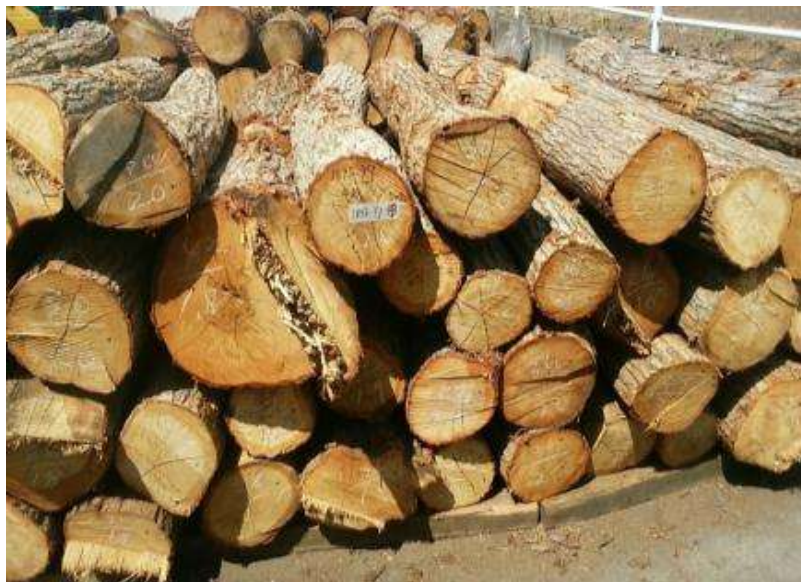
樹種: ナラ 材長: 1.8-2.1 m 管理No. 37 径級: 20-42 cm 本数: 48 材積: 7.687 m 3