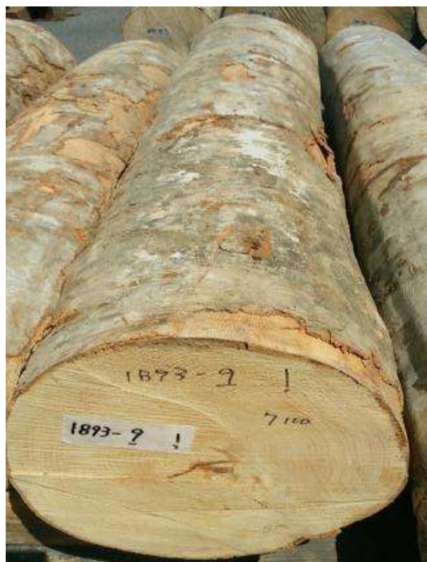
樹種: ブナ 材長: 1.9 m 管理No. 9 径級: 36 cm 本数: 1 材積: 0.246 m 3