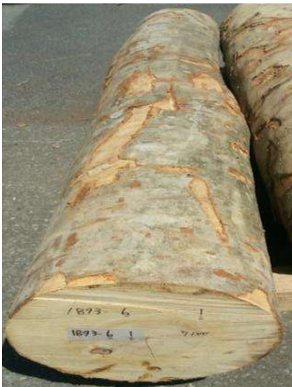
樹種: ブナ 材長: 2.2 m 管理No. 6 径級: 36 cm 本数: 1 材積: 0.285 m 3