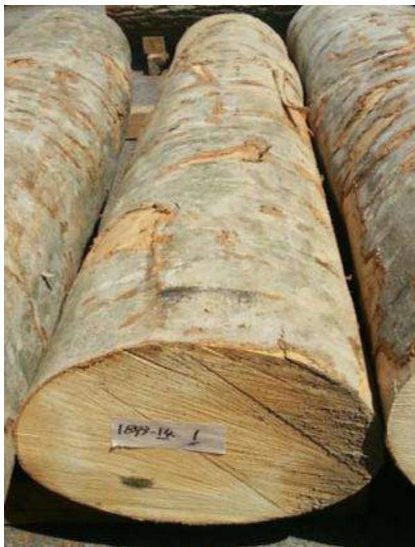
樹種: ブナ 材長: 2.2 m 管理No. 14 径級: 30 cm 本数: 1 材積: 0.198 m 3