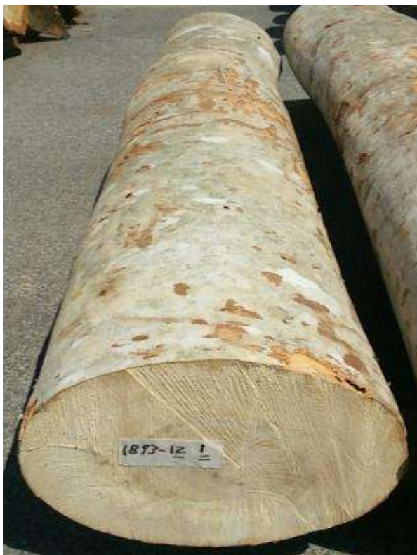
樹種: ブナ 材長: 2.2 m 管理No. 12 径級: 30 cm 本数: 1 材積: 0.198 m 3