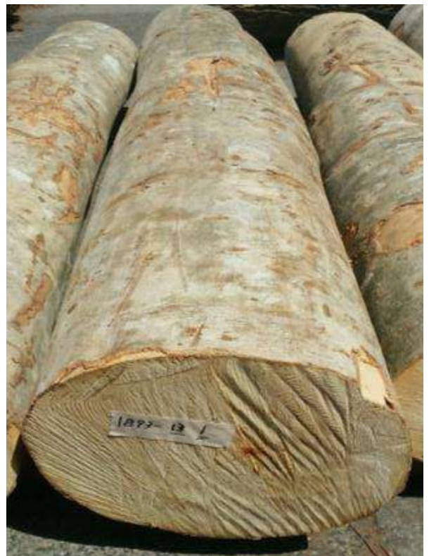
樹種: ブナ 材長: 2.2 m 管理No. 13 径級: 32 cm 本数: 1 材積: 0.225 m 3