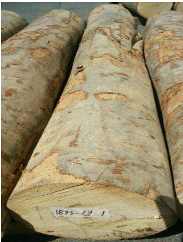
樹種: ブナ 材長: 2.2 m 管理No. 19 径級: 30 cm 本数: 1 材積: 0.198 m 3