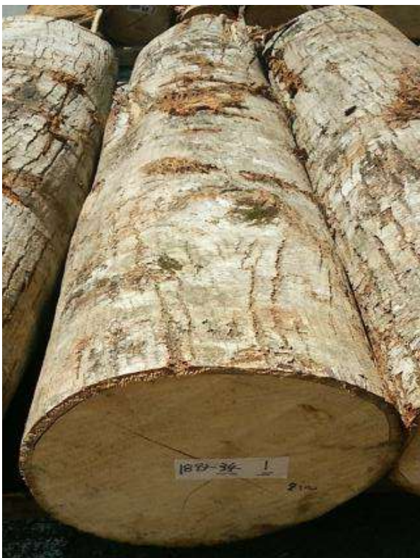
樹種: シナ 材長: 2.2 m 管理No. 34 径級: 32 cm 本数: 1 材積: 0.225 m 3