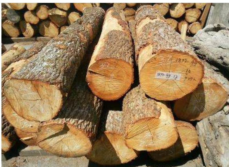
樹種: クヌギ 材長: 1.9-2.2 m 管理No. 44 径級: 26-34 cm 本数: 12 材積: 2.320 m 3