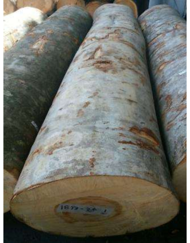
樹種: ブナ 材長: 2.2 m 管理No. 25 径級: 34 cm 本数: 1 材積: 0.254 m 3