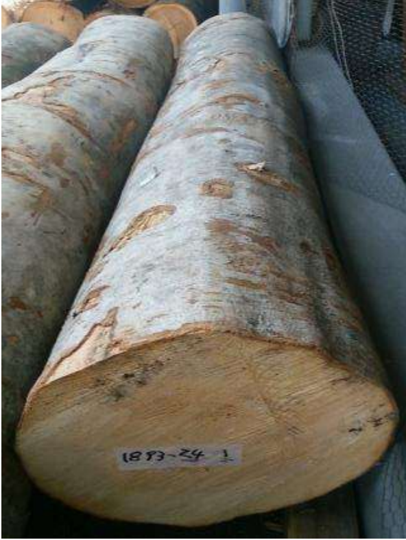
樹種: ブナ 材長: 2.2 m 管理No. 24 径級: 32 cm 本数: 1 材積: 0.225 m 3