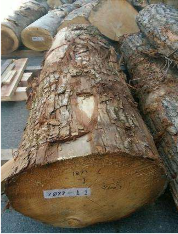
樹種: サワグルミ 材長: 2.2 m 管理No. 1 径級: 42 cm 本数: 1 材積: 0.388 m 3