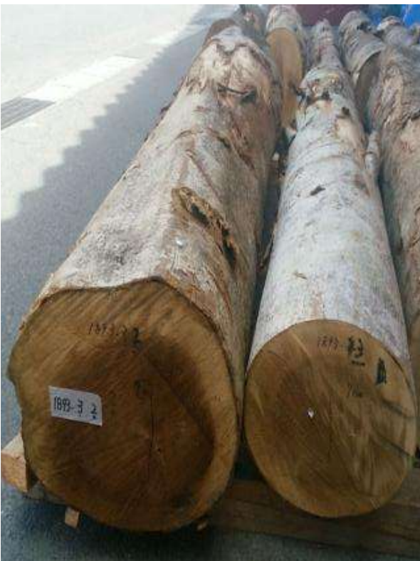
樹種: ホオノキ 材長: 2.2 m 管理No. 3 径級: 30-38 cm 本数: 2 材積: 0.516 m 3