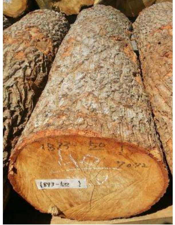
樹種: クヌギ 材長: 2.0 m 管理No. 50 径級: 40 cm 本数: 1 材積: 0.320 m 3