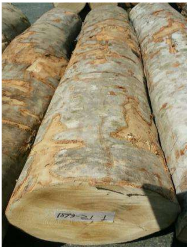
樹種: ブナ 材長: 2.2 m 管理No. 21 径級: 30 cm 本数: 1 材積: 0.198 m 3