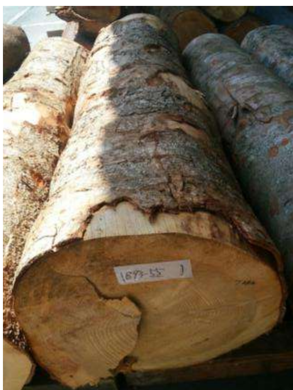
樹種: モミ 材長: 2.1 m 管理No. 55 径級: 50 cm 本数: 1 材積: 0.525 m 3