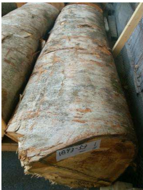
樹種: ケヤキ 材長: 2.0 m 管理No. 53 径級: 34 cm 本数: 1 材積: 0.231 m 3