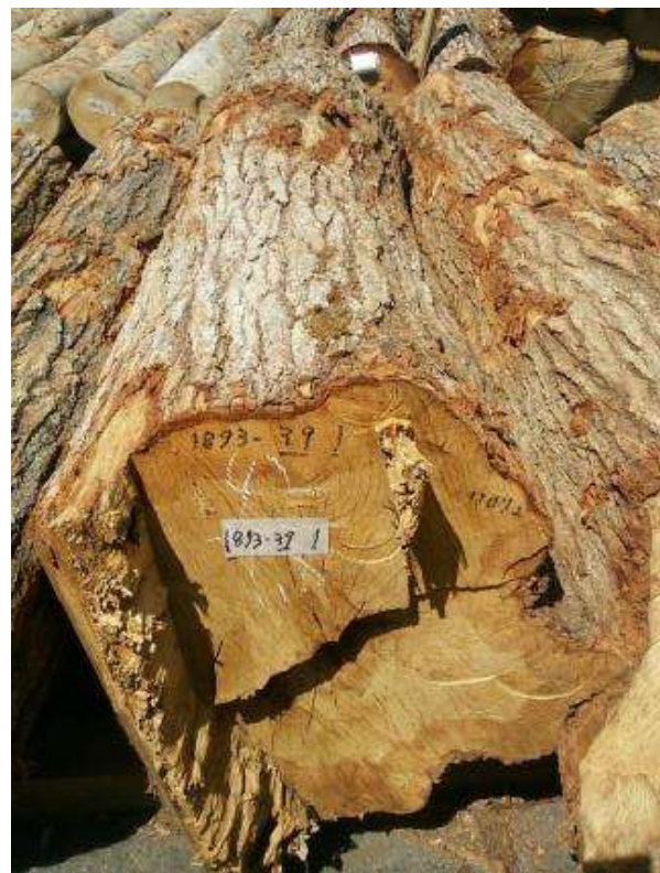
樹種: ナラ 材長: 1.8 m 管理No. 39 径級: 42 cm 本数: 1 材積: 0.318 m 3