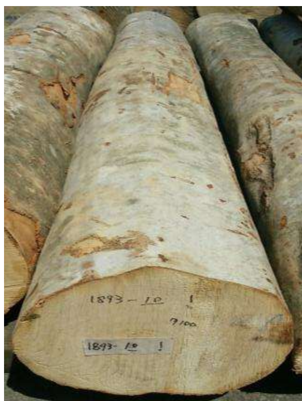
樹種: ブナ 材長: 2.2 m 管理No. 10 径級: 30 cm 本数: 1 材積: 0.198 m 3