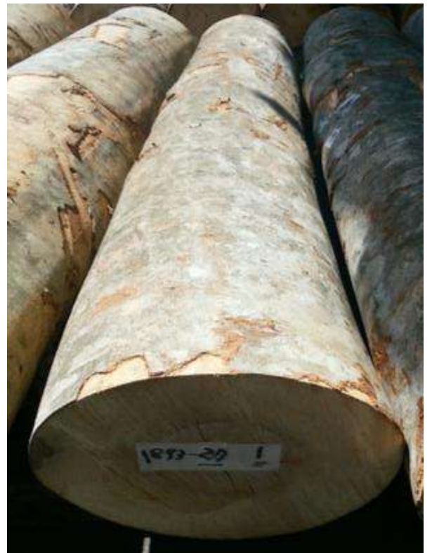
樹種: ブナ 材長: 2.2 m 管理No. 27 径級: 30 cm 本数: 1 材積: 0.198 m 3