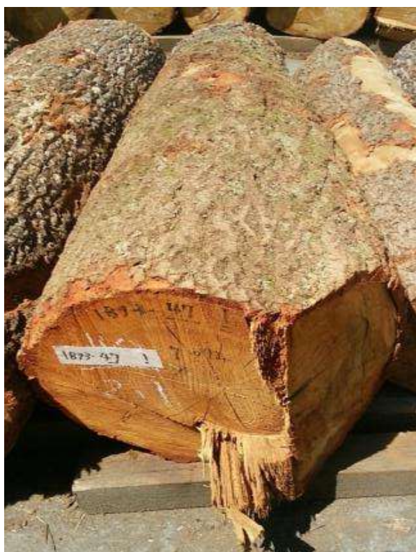
樹種: クヌギ 材長: 2.1 m 管理No. 47 径級: 40 cm 本数: 1 材積: 0.336 m 3