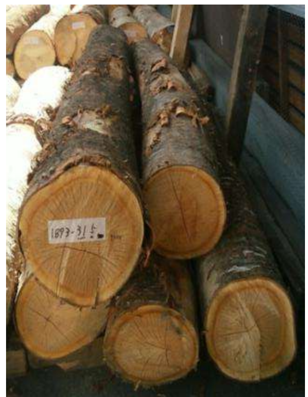
樹種: サクラ 材長: 1.9-2.2 m 管理No. 31 径級: 22-28 cm 本数: 5 材積: 0.642 m 3