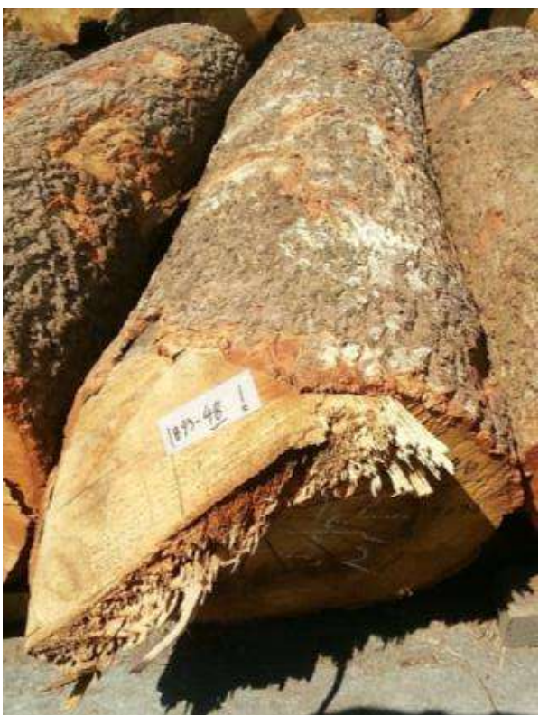
樹種: クヌギ 材長: 2.2 m 管理No. 48 径級: 42 cm 本数: 1 材積: 0.388 m 3