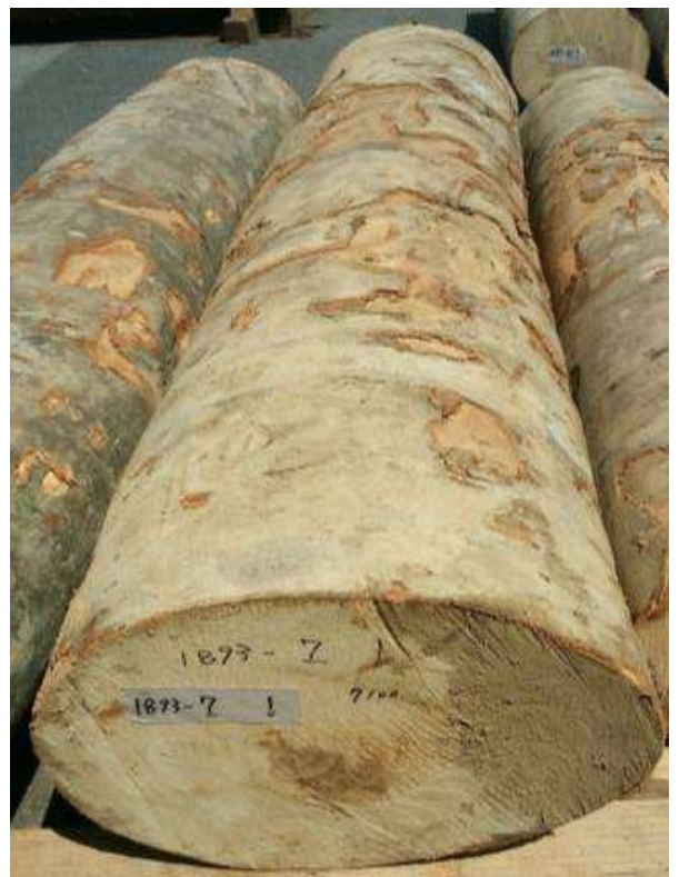
樹種: ブナ 材長: 1.9 m 管理No. 7 径級: 42 cm 本数: 1 材積: 0.335 m 3