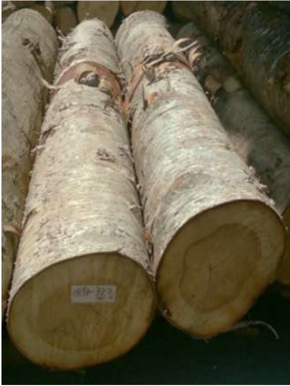
樹種: シラカバ 材長: 2.2 m 管理No. 32 径級: 30 cm 本数: 2 材積: 0.396 m 3