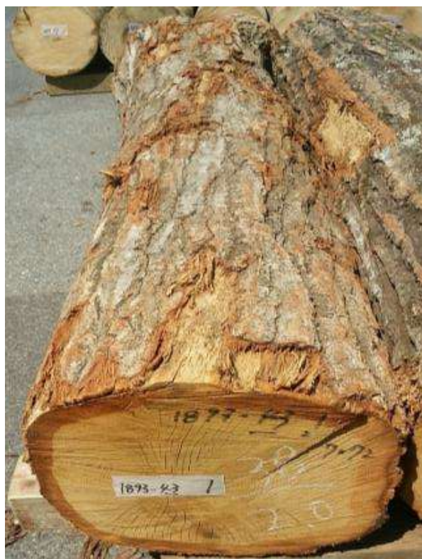
樹種: ナラ 材長: 2.0 m 管理No. 43 径級: 38 cm 本数: 1 材積: 0.289 m 3