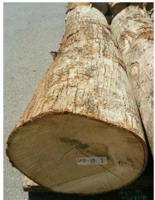
樹種: シナ 材長: 2.2 m 管理No. 35 径級: 42 cm 本数: 1 材積: 0.388 m 3