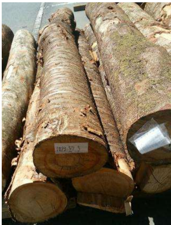
樹種: サクラ 材長: 2.0-2.1 m 管理No. 57 径級: 20-28 cm 本数: 6 材積: 0.731 m 3