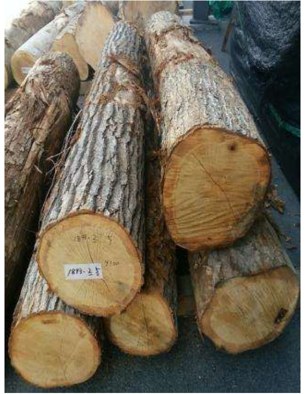
樹種: ナラ 材長: 2.0-2.2 m 管理No. 2 径級: 24-32 cm 本数: 5 材積: 0.848 m 3