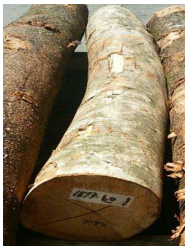
樹種: ケヤキ 材長: 2.2 m 管理No. 60 径級: 28 cm 本数: 1 材積: 0.172 m 3