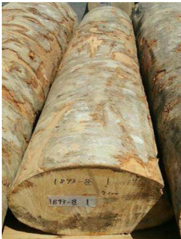
樹種: ブナ 材長: 1.9 m 管理No. 8 径級: 30 cm 本数: 1 材積: 0.171 m 3