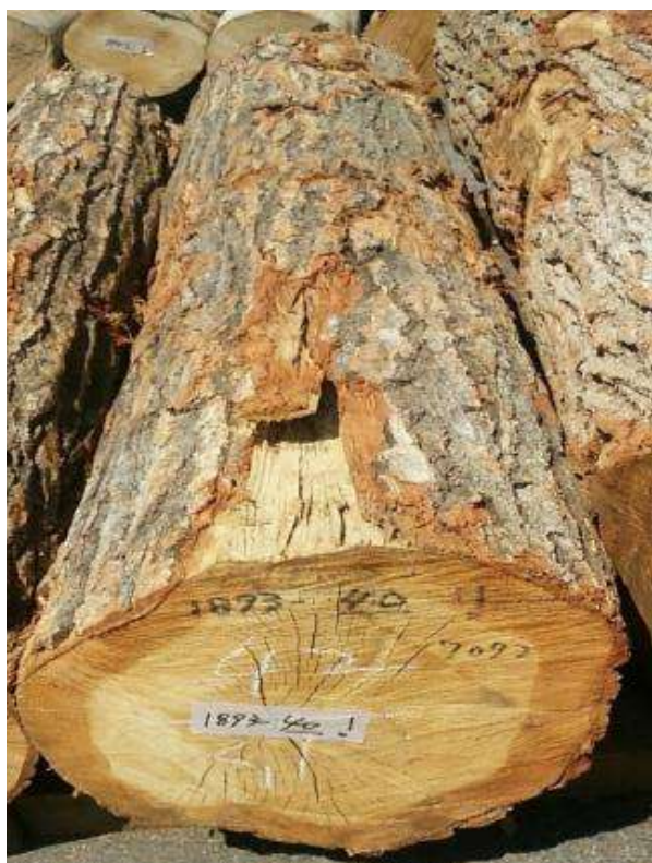
樹種: ナラ 材長: 2.1 m 管理No. 40 径級: 42 cm 本数: 1 材積: 0.370 m 3