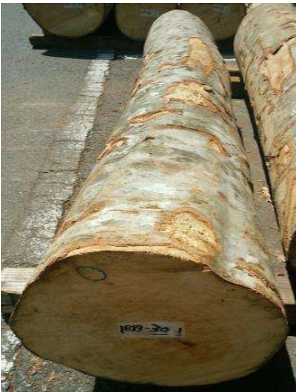
樹種: ブナ 材長: 2.2 m 管理No. 30 径級: 34 cm 本数: 1 材積: 0.254 m 3