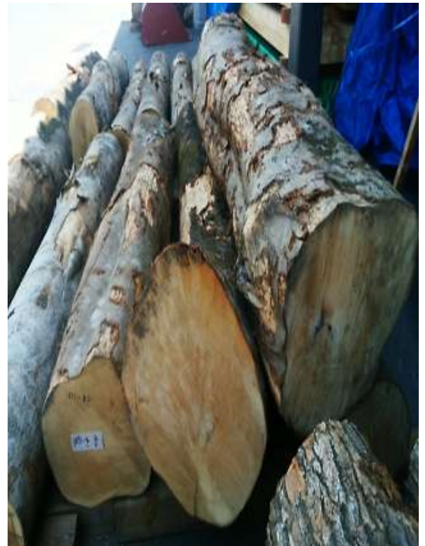
樹種: イタヤ 材長: 2.0-2.2 m 管理No. 4 径級: 30-36 cm 本数: 4 材積: 0.985 m 3