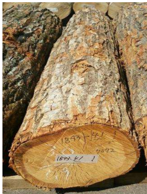
樹種: ナラ 材長: 1.9 m 管理No. 41 径級: 30 cm 本数: 1 材積: 0.171 m 3