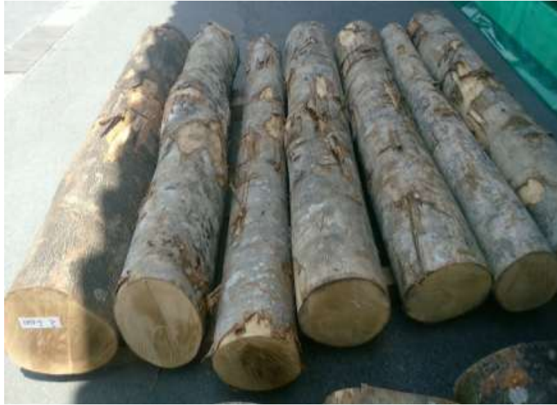
樹種: ホオノキ 材長: 2.0-2.2 m 管理No. 5 径級: 22-34 cm 本数: 7 材積: 1.107 m 3