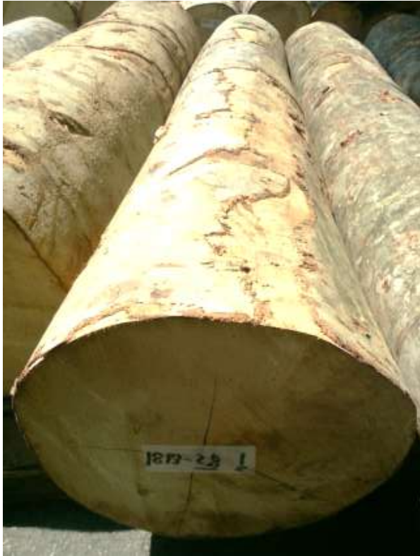
樹種: ブナ 材長: 2.2 m 管理No. 28 径級: 32 cm 本数: 1 材積: 0.225 m 3