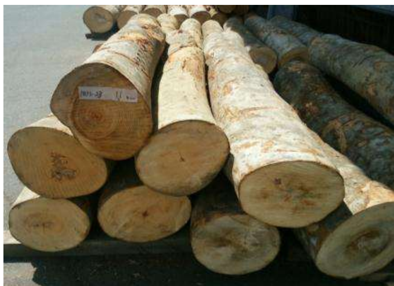
樹種: ブナ 材長: 2.0-2.2 m 管理No. 23 径級: 30-36 cm 本数: 11 材積: 2.402 m 3