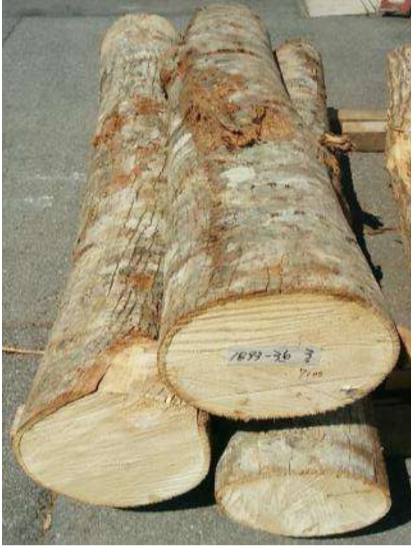
樹種: シナ 材長: 2.1-2.2 m 管理No. 36 径級: 22-30 cm 本数: 3 材積: 0.460 m 3