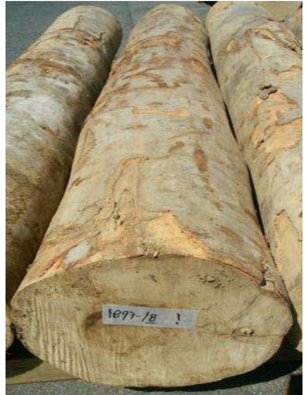
樹種: ブナ 材長: 2.2 m 管理No. 18 径級: 30 cm 本数: 1 材積: 0.198 m 3