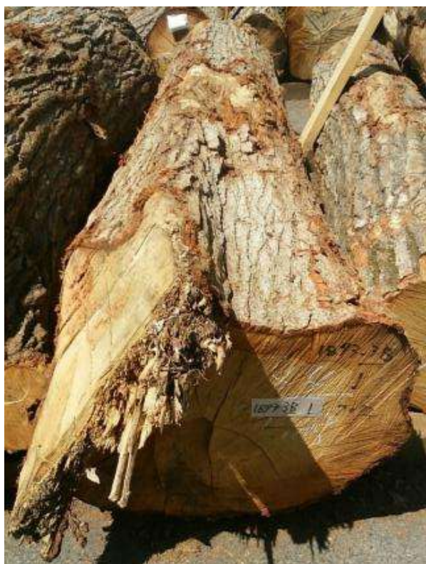
樹種: ナラ 材長: 1.8 m 管理No. 38 径級: 44 cm 本数: 1 材積: 0.348 m 3