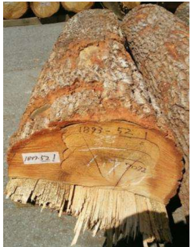
樹種: クヌギ 材長: 1.9 m 管理No. 52 径級: 38 cm 本数: 1 材積: 0.274 m 3