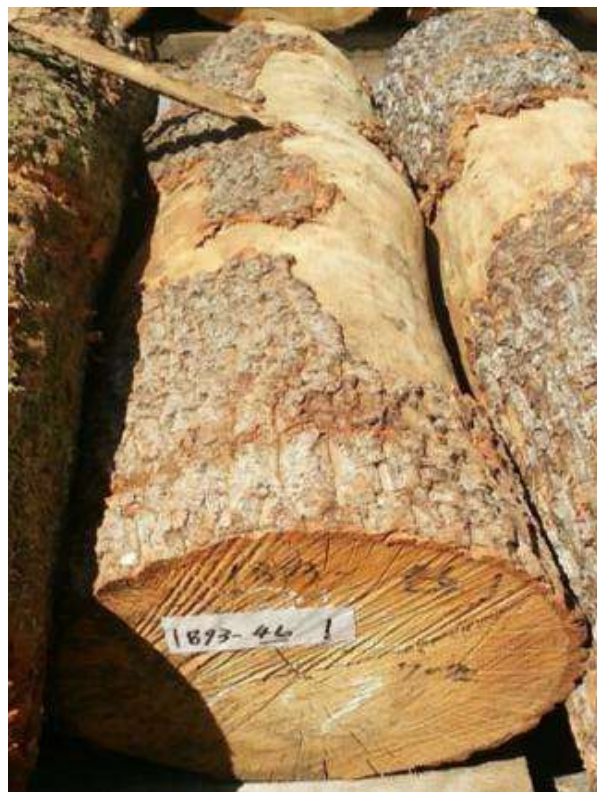
樹種: クヌギ 材長: 1.9 m 管理No. 46 径級: 34 cm 本数: 1 材積: 0.220 m 3