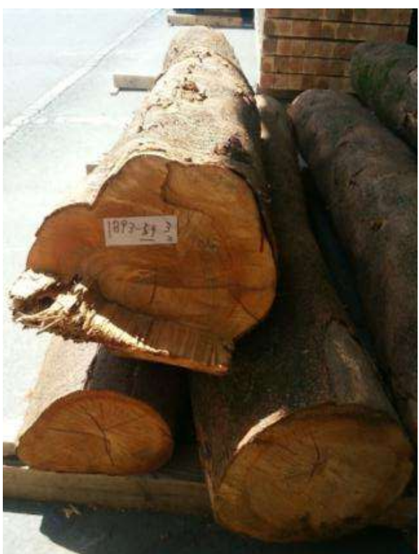
樹種: サクラ 材長: 1.9-2.0 m 管理No. 59 径級: 26-32 cm 本数: 3 材積: 0.510 m 3