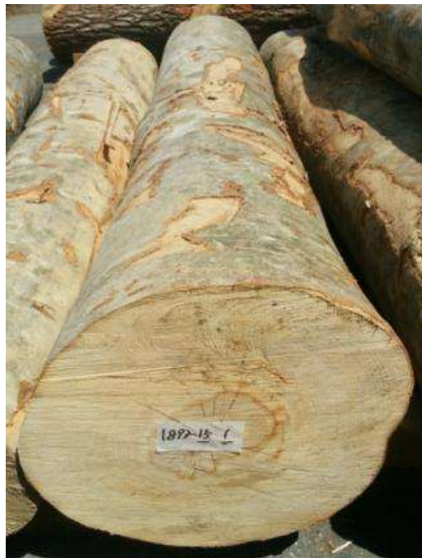
樹種: ブナ 材長: 2.2 m 管理No. 15 径級: 36 cm 本数: 1 材積: 0.285 m 3